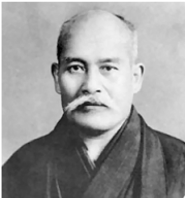
Ueshiba Morihei *1883 +1969

Nach jahrzehntelangem Studium der japanischen Kampfkünste schuf der Begründer Morihei Ueshiba Aikido. Er wollte dabei die Tugenden der Samurai für die moderne Zeit nutzbar machen. Dabei verzichtete Ueshiba Morihei bewusst auf den Wettkampf.